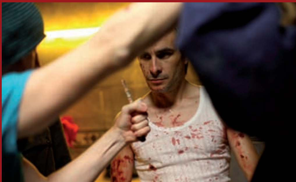
⤴ Ambit dando indicaciones.

que se hizo imposible de rodar por no tener ni financiación ni un trabajo anterior que lo avalara, con lo que me planteé hacer un corto". A la hora de escribir el cortometraje, el cineasta eligió una cobertura fantástica que le permitiera profundizar en los miedos de los personajes y se puso en contacto con Ignacio, cortometrajista autor de piezas como "Oscuro silencio" o "Frio", arqueólogo y célebre por organizar los ciclos de cine de terror de Halloween en la Filmoteca de Murcia. La relación entre ambos se había fraguado tiempo atrás, cuando tras un programa en una televisión local en el que uno realizaba y el otro era entrevistado, descubrieron el amplio abanico de gustos